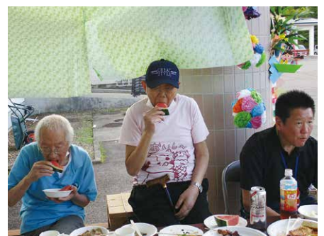
🍉初物スイカ甘くて旨い🍉