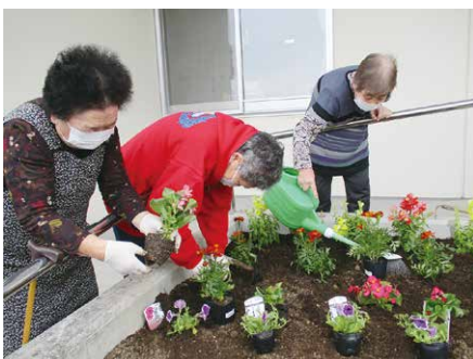
✿花いっぱい大きく育って✿