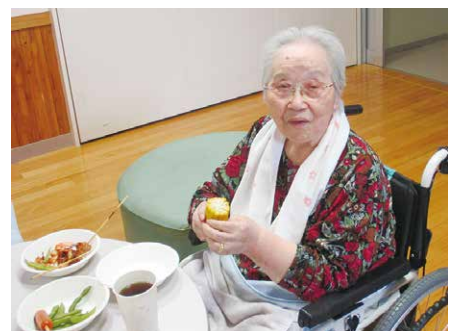
🍉美味しくて1本食べれるよ🍉