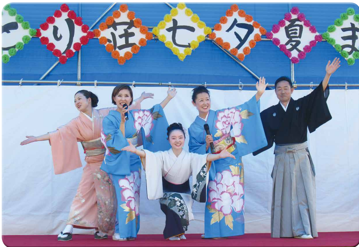
美味しいものを食べたり歌や踊りを見て楽しみました！！