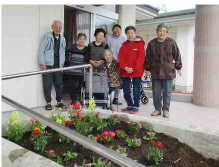
✿きれいな花壇で皆♡笑顔✿