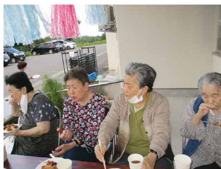
☺皆で食べて最高に美味しい☺