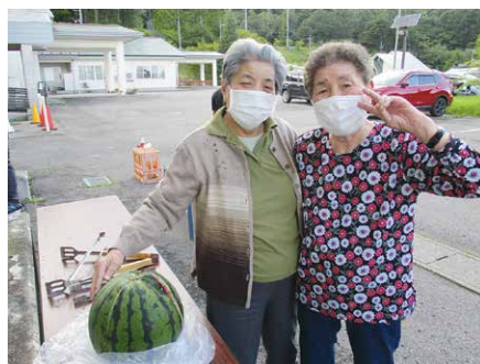
☺二人でスイカ割したよ☺