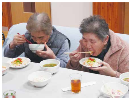
♪ちらし寿司おいしいね☺♪