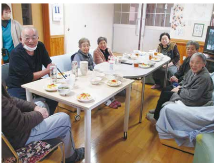
♪ひな祭りみたい美味しそう♪