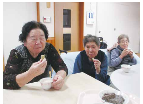
♪豆しとき昔の味がするね〜(^^)♪