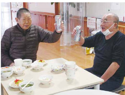
☺まんず男同士 乾杯☺