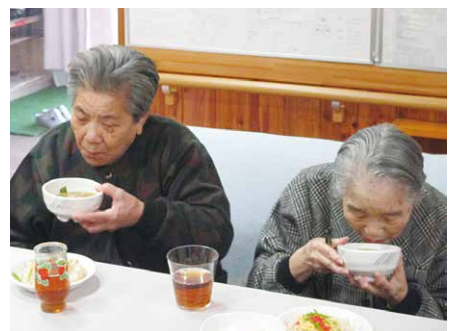
☺すまし汁もおいしがすか☺