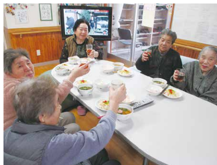
☺皆で楽しく元気でいようね☺