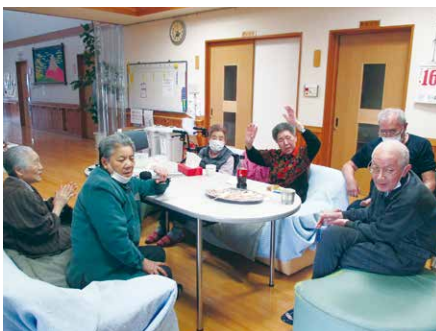
♪歌って踊って楽しもう～♪