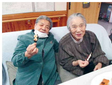
☺団子はおいしいね(^)もう1本食べれるよ☺