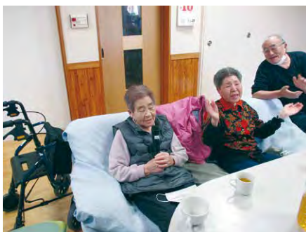
☺民謡いいね♪みんなで歌うか☺