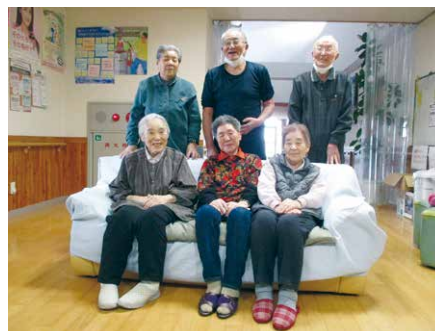
皆♡笑顔で楽しく元気でいようね