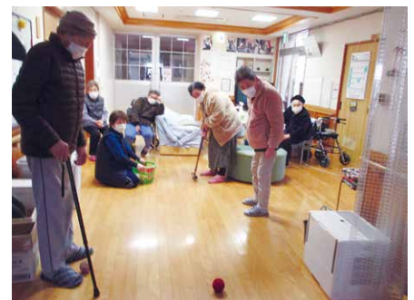
♪ボールなかなか入らないよ～♪